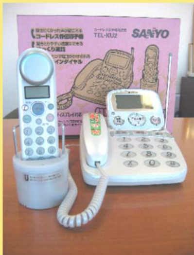
コードレス骨伝導電話機 (SANYO)