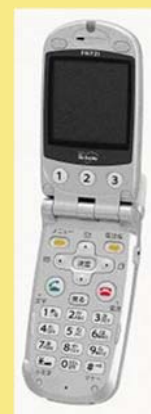
らくらくホンⅢ F672i (NTTドコモ)