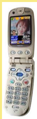
FOMAらくらくホン F880iES (NTTドコモ)